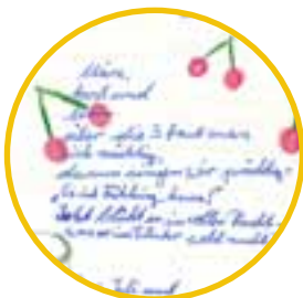
Dichten – ein Erlebnis in Reime fassen.