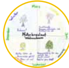
Orientierung in Zeit und Raum – Jahreszeitentagebücher und Wetterbeobachtungen