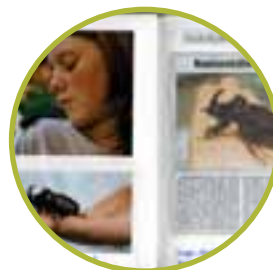
Recherchieren – Zeitungsartikel, Internetbeiträge, Rezepte und Gedichte zum Thema suchen

„In meinem Naturtagebuch stehen Gedichte, Rezepte, Geschichten, Steckbriefe, Beobachtungen, ...“