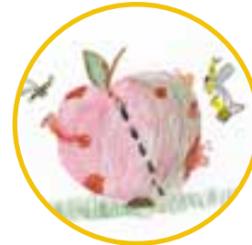
Lebensmittel entdecken – Gemüse und Obst anbauen, ernten und verarbeiten