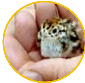
Natur mit allen Sinnen wahrnehmen

// Ein Blick in die Welt der Naturtagebücher zeigt eindrücklich, dass durch die Vielfalt der möglichen Themen und Methoden verschiedenste fachbezogene Kompetenzen gefördert werden.