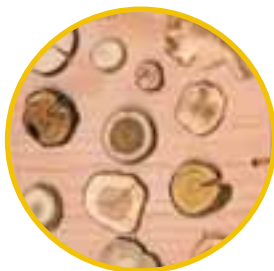
Mit Naturmaterialien basteln – Ein Umschlag aus Holz