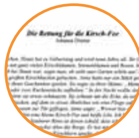
Eigene Geschichten erfinden