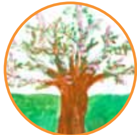
Phantasievolles, farbiges Malen – Bäume in den Jahreszeiten