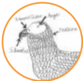
Detailgenaues Zeichnen – der Kopf eines Graupapageis