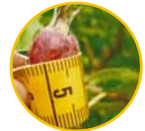
Experimente – Wachstum und Verhalten unter verschiedenen Bedingungen beobachten