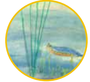
Verschiedene heimatliche Lebensräume und deren Tiere und Pflanzen kennenlernen