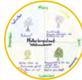
Orientierung in Zeit und Raum – Jahreszeitentagebücher und Wetterbeobachtungen