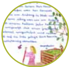
Formulieren üben – Erlebnisse und Beobachtungen detailliert beschreiben