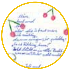
Dichten – ein Erlebnis in Reime fassen.