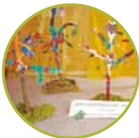
Plastisches Gestalten – Ein Kastanienwald aus Pappmachee