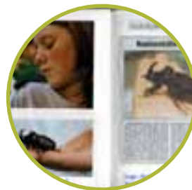
Recherchieren – Zeitungsartikel, Internetbeiträge, Rezepte und Gedichte zum Thema suchen

„In meinem Naturtagebuch stehen Gedichte, Rezepte, Geschichten, Steckbriefe, Beobachtungen, ...“